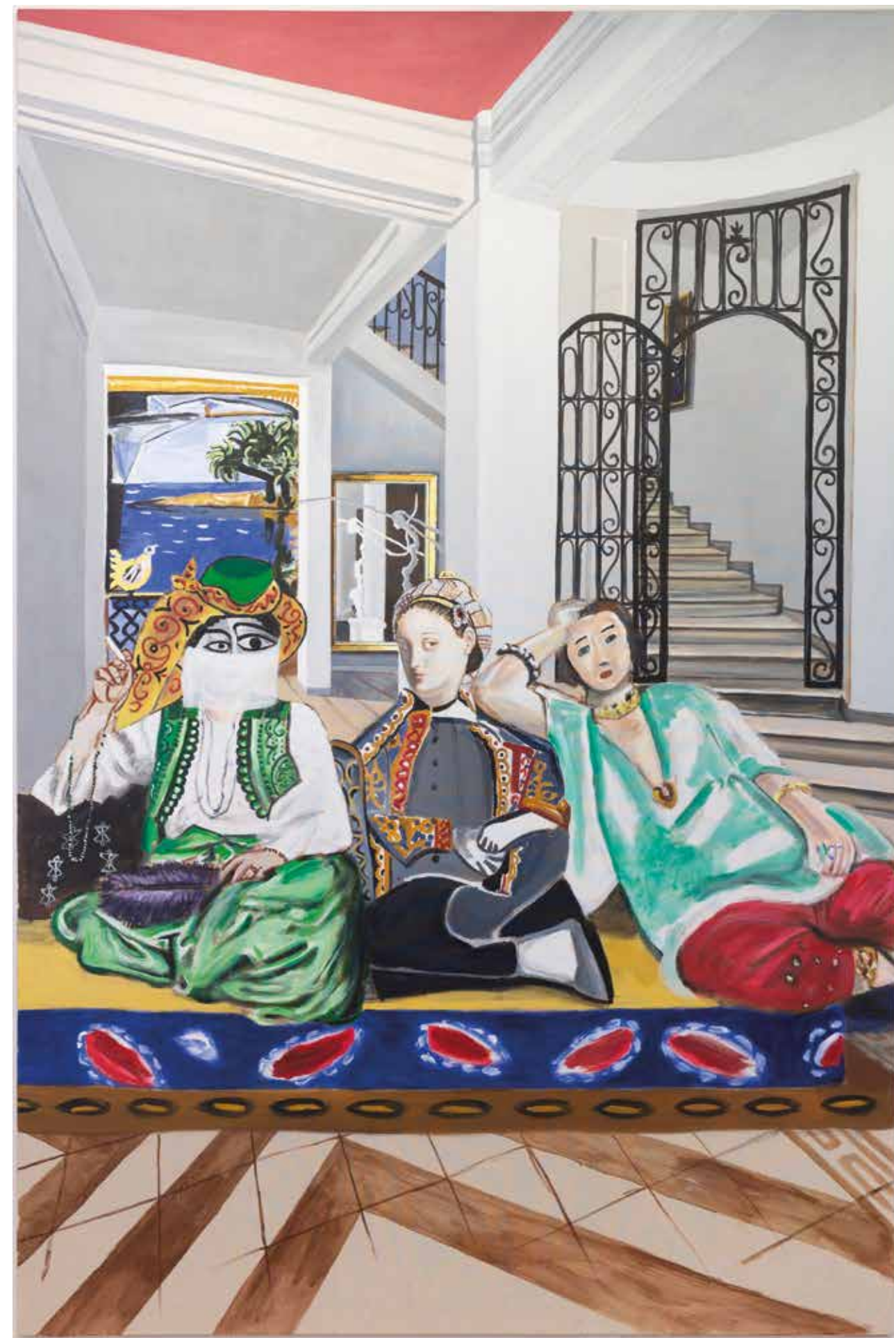
Alun Williams, Hommage à la Ténacité des Femmes: Marie-Rose, Amélie et Élodie Michel , 2019. Huile et acrylique sur toile / oil and acrylic on canvas, 300 × 200cm, Collection Villa Tamaris Centre d'Art.