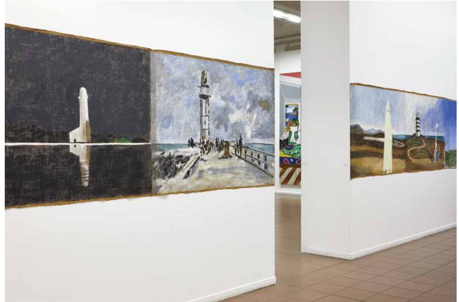
À gauche / left: vue partielle de Alun Williams, Phares 4 , 2019. Acrylique sur toile de jute / acrylic on burlap, 108 x 766 cm. À droite / right: vue partielle de / partial view of Alun Williams, Phares 6 , 2019. Acrylique sur toile de jute / acrylic on burlap, 108 x 455 cm.

De fait, Williams identifie, avec ces taches, des personnages historiques qu'il choisit plus ou moins en fonction de ses affinités et du hasard. Il en est ainsi de Thomas Paine, que l'on connaît assez peu en France bien qu'il ait joué un rôle non négligeable au moment de la révolution de 1789. En Amérique du Nord, il a pris une part active au processus d'indépendance des treize colonies britanniques et, s'il meurt dans l'isolement, il est célébré par la suite pour son influence auprès des révolutionnaires. Williams s'est donc intéressé au personnage et, à la suite d'une enquête l'ayant mené du Royaume-Uni aux États-Unis qui sont les pays — avec la France — pour lesquels le théoricien s'est profondément engagé; il a traqué et retrouvé une tache qui, pour lui, sans aucune hésitation, peut être attribuée à Paine. Comment se forme sa conviction 3 ? Peu importe. Ce qui importe, c'est que ce soit une trace qui, pour Williams, identifie le personnage sans conteste et qui, à partir de ce moment, participera des nombreux tableaux dédiés au personnage en question. De fait, cette éclaboussure dans laquelle s'incarne ce récit invisible est objectivement une abstraction formelle tout en étant l'indice d'une présence au monde, d'une vie. Une espèce d'abstraction représentative, d'une