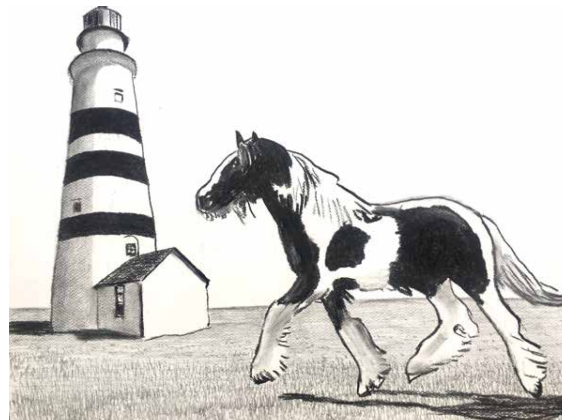
Alun Williams, Phare #43 (La falaise sombre) , 2019. Encre sur papier / ink on paper.