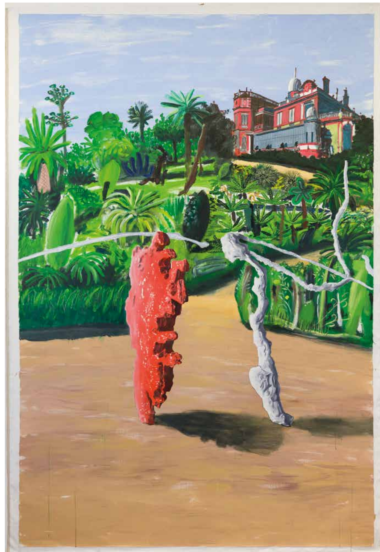
Alun Williams, Aux Visionnaires Modernes : Jules Verne et Michel Pacha (Tamaris circa 1888) , 2019. Huile et acrylique sur toile / oil and acrylic on canvas, 300 × 200cm, Collection Villa Tamaris Centre d'Art.

managed in its form, whether it be 'dripped' or whether it refers to an assertive desire for non-representation, as a symbol of the specificity of painting (cf. again, Greenberg). But Williams's splotches are not exactly this, they are both, they represent and they are abstract, they are clues and they are autonomous. These splotches are anything but random forms, they owe nothing to chance. According to the artist, they are actually the traces of the terrestrial passage of these figures, whiffs of their activity, accidental or otherwise, which he unquestioningly attributes to their "author" and which will recur inside a series of pictures and sculptures that will be dedicated to them. Whether thoroughly real or fantasized, these found traces are presented in the pictures in the form of clues, like for example the ink stain from a fountain pen that has leaked, become solidified over the years, and which the artist came upon, abandoned under the desk of a country house-turned-museum... This invisible part of the