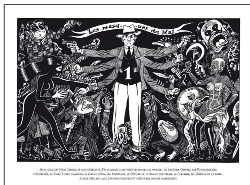
Galerie Anne Barrault.